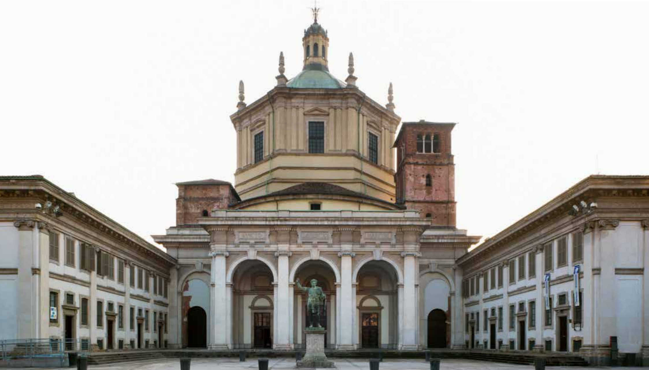
Basilica di S. Lorenzo Maggiore, Milano